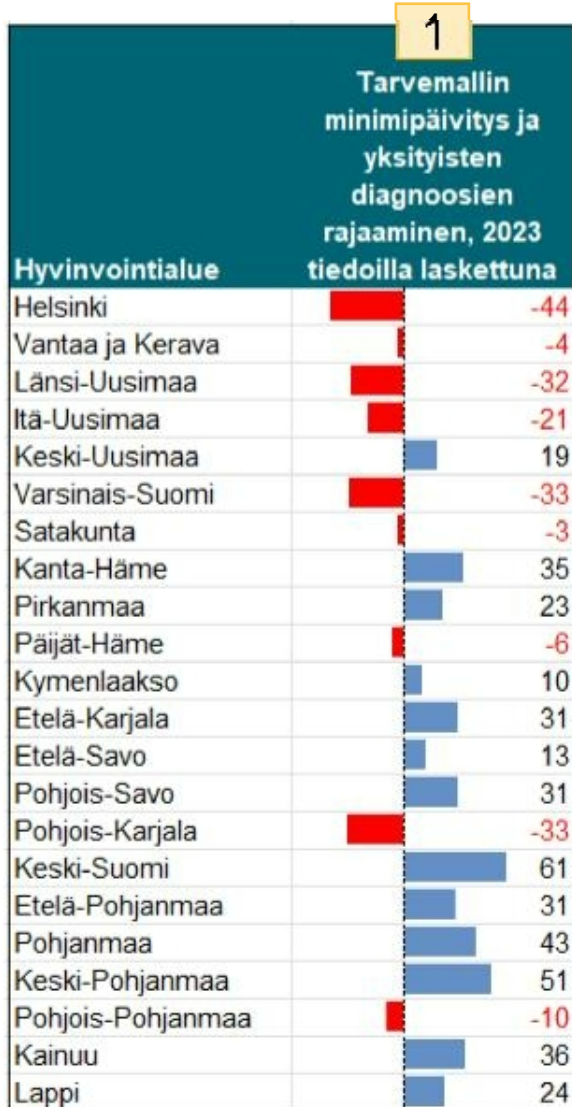
Vaikutukset lausuntokierroksella (2023 tiedot)